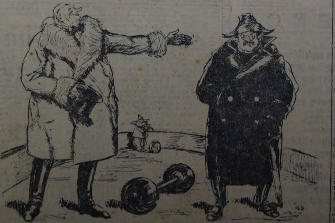
EL DIRECTOR — Estimado público: tengo el honor de presentarles a mi ministro de guerra, paracaidista famoso, quien es el autor de la ruidosa atracción "Intercambio de profesores", que tantos aplausos ha cosechado.