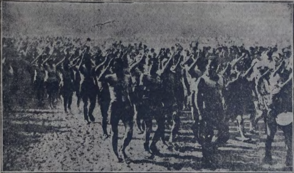
EN LA RUSIA SOVIETICA SON TAMBIEN ENTUSIASTAS Y NUMEROSAS LAS MANIFESTACIONES DEL MUSCULO — VEMOS AQUI UN DESFILE DE ATLETAS CON MOTIVO DE UN RECIENTE TORNEO REALIZADO EN MOSCU.